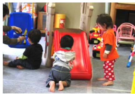
お気に入りのあそびは何か?