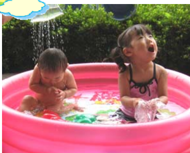
プールあそび楽しいね!