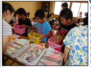
消費生活センターによる 食材サンプルお買い物ゲーム