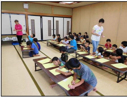
夏休み交通安全教室