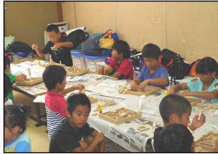
工作「ビー玉迷路」作り