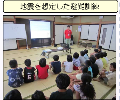
地震を想定した避難訓練