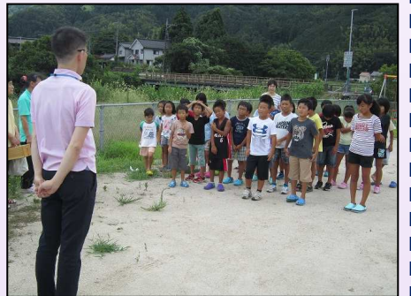
「なしっこ館」 & 「青山剛昌ふるさと館」