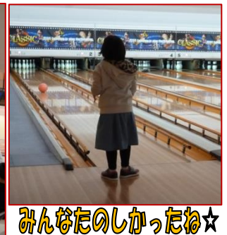
みんなのしかったね☆