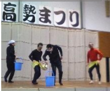
楽しいやざダンス