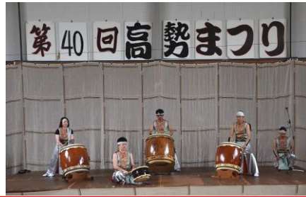
えん太による行者太鼓