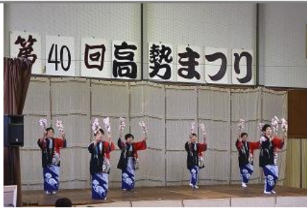
なつかしい桜音頭(小河内)