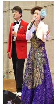
歌謡ショー(オーブ)