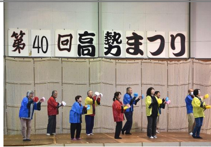
実光集落の皆さんと高勢老人クラブ皆さんの踊り