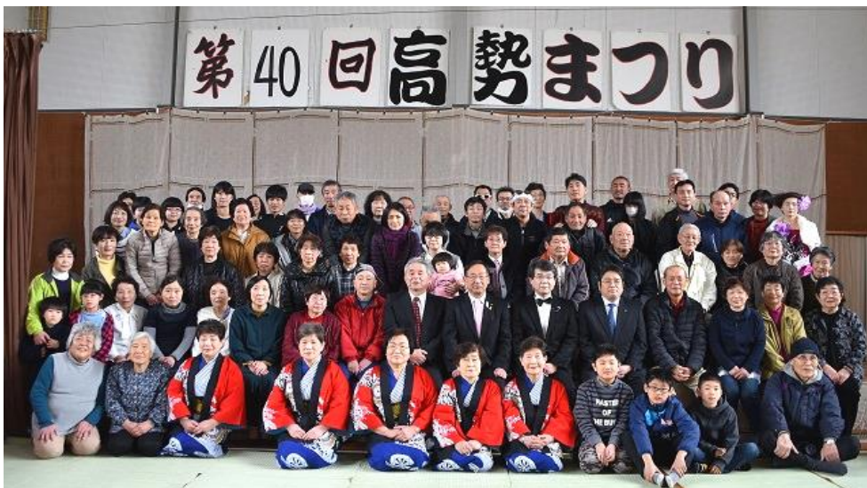
記念撮影は笑顔ではいポーズ！