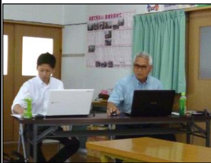
三村氏・國米氏よりの研修

・スマイルカフェ: 第2・4木曜日に100円で開催 ・ワンコイン居酒屋: 第2土曜日に1品持寄りと500円で実施