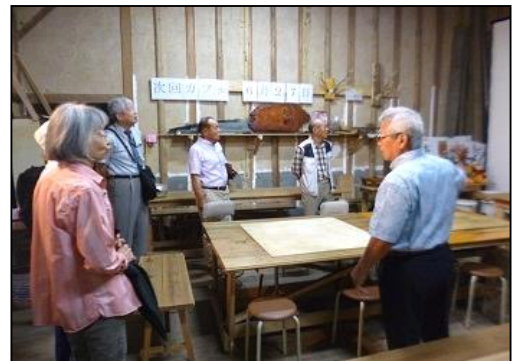
米倉庫を利用したスマイルカフェ