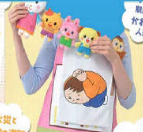
エプロンシアター