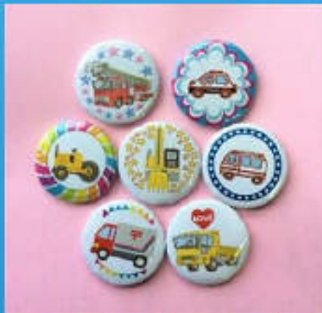
のりもの缶バッジ

・ショベルカーのラジコンで重機消しゴムや のりもの缶バッジをゲット！ ・ショベルカーのしおり作り