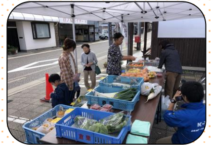
同会場では、野菜などの販売も行いました。