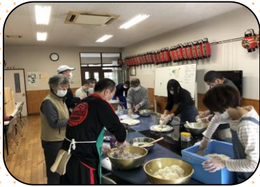
おにぎりを作りました！

10月27日(日)温泉広場で『温泉芋煮会』を開催しました。秋晴れの中、たくさんの皆様が参加してくださいました。用意していた200食分の芋煮は、すべてなくなりお鍋の中は、からっぽとなりました。地域の方、観光客の方とたくさんみなさんにきていただきました。みんなニコニコで何杯もおかわりしていただきました！