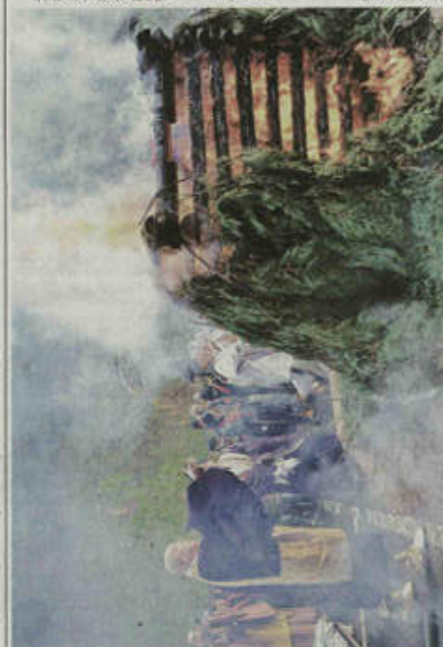
燃え盛る護摩壇に参拝者の願い事が書かれた護摩木を投げ入れる清水寺真主。17日、安来市清水町

月23日に聖火トーチを持った走者が町内を駆け抜ける。町は「絶好のタイミングで見つかったトーチ。町民らに披露し、聖火リレーを盛り上げたい」と話している。(前田雅博)