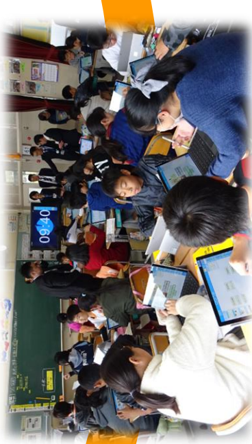
伊保小学校 ICT 教育（愛知県）