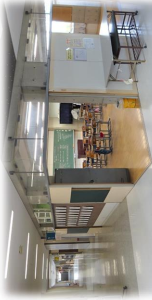
岐阜小学校 普通教室（岐阜県）