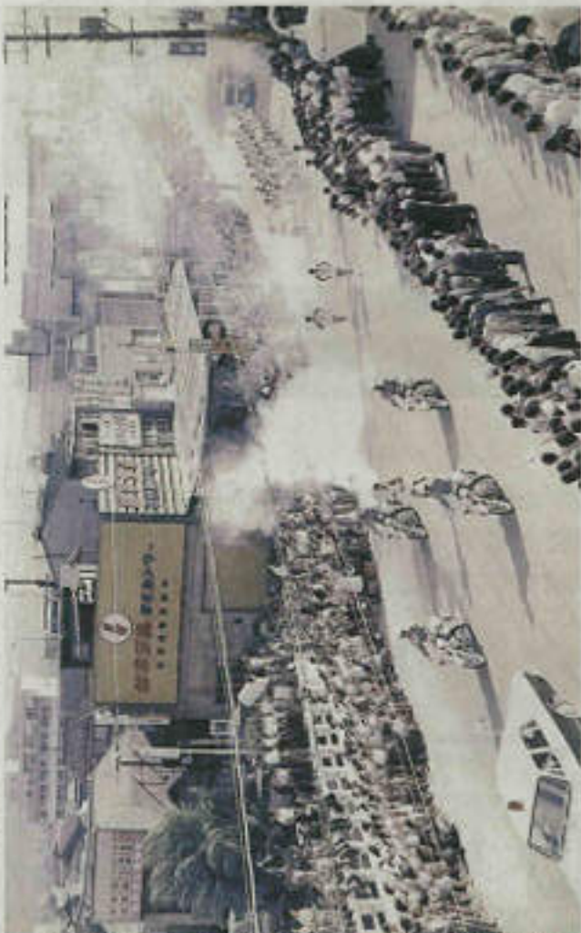
鳥取市の若狭街道を通過する前回の東京五輪の聖火リレー。今回も同じ場所を走る。1964年9月25日

2020年東京五輪・パラリンピック組織委員会が五輪の聖火リレーのコースを発表した日、鳥取県内のコースの沿道や沿道の観光、商業関係者や住民からは、五輪の機運が県内から盛り上がることへの期待感や、同様に県内で行われた1964年東京五輪の聖火リレーを懐かしむ声が続出した。(取材班)