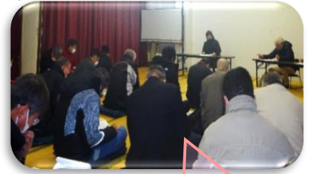
36名の方々にご出席いただきました。