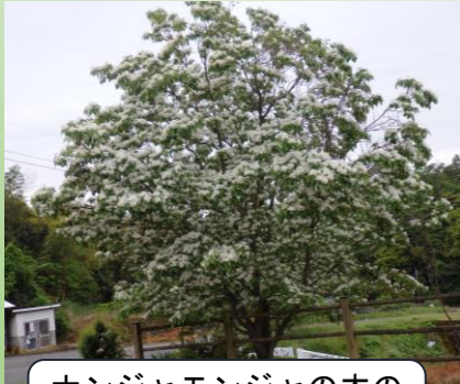
ナンジャモンジャの木の 花が満開でした。

5月11日（火）、吉尾公民館でわたげカフェを開店しました。今回は日本海新聞社の方に新聞紙を使ったエコバッグの作り方を教えていただきました。その他にも、新聞の読み方、楽しみ方をスライドで説明していただき、間違い探しをしながら、皆さん積極的にクイズにも参加され、会員も一緒に、わいわいとにぎやかな楽しい時間を過ごすことが出来ました。