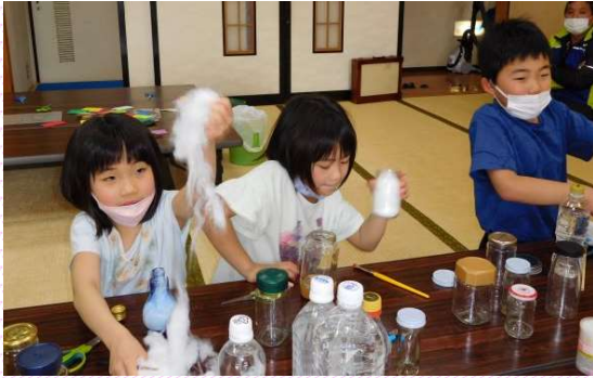
図書館がやってくる! 読み聞かせ&工作