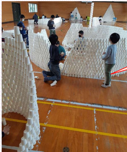
県立博物館から紙コップ 1万個がやって来ました! 協力して超大作を作ったり 一人で楽しんだり思い思いの 作品が出来ました