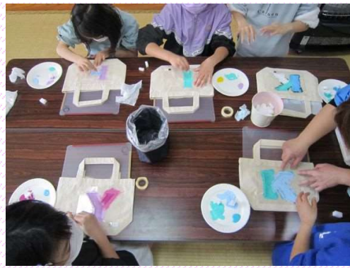
バッグにステンシルペイントしたよ。