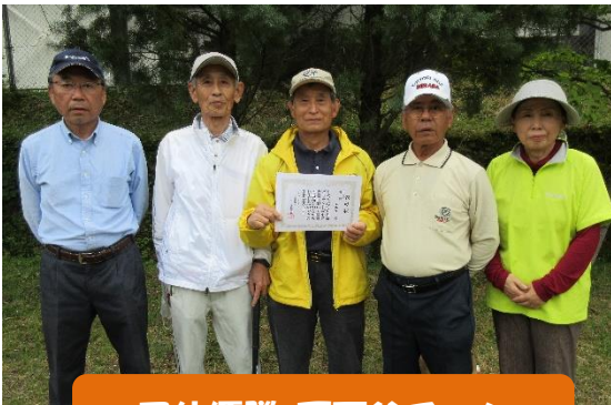
団体優勝 下西谷チーム