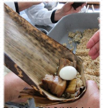
中華ちまきの具は盛りだくさん!