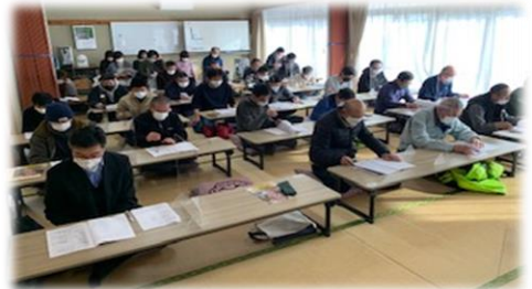
※定期総会の資料は、みささ村公民館に置いています。

議事では、(1)令和4年事業実績及び収支決算 (2)令和5年事業計画及び収支予算(案)について審議した結果、2つの議案ともに可決されましたのでご報告します。