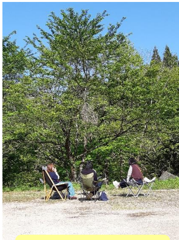
のんびりチェアリング♪