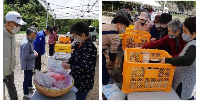
小鹿地域2グループの出店。 おこわ・よもぎ餅・山菜弁当は早々に完売!!