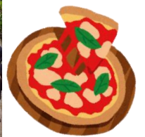
リトルバンビさんの窯焼きピザ・自家焙煎コーヒー・スモア・小物も大好評!!