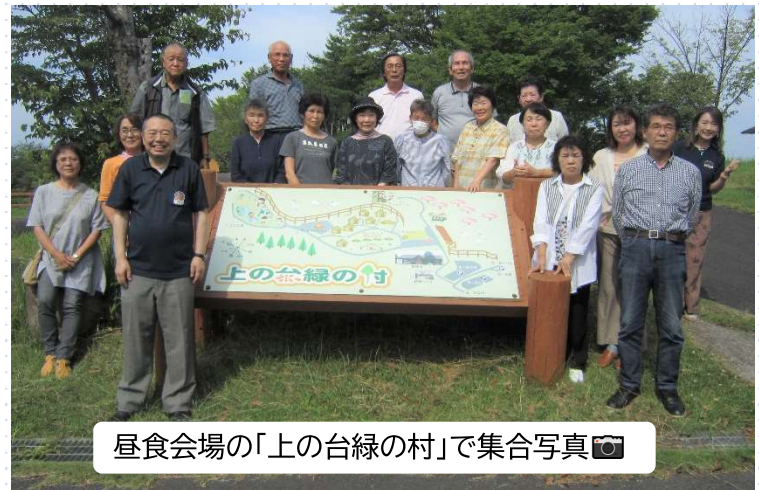
昼食会場の「上の台緑の村」で集合写真📷