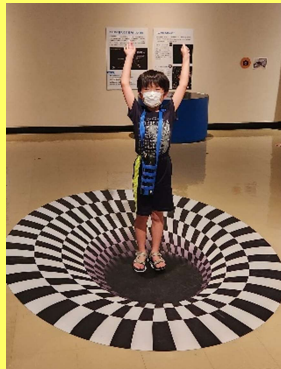
鳥取県立博物館「アインシュタイン展」