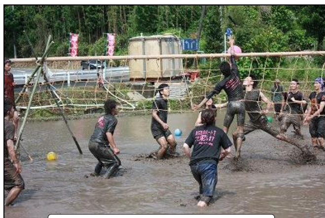
第11回泥んこバレー大会の様子