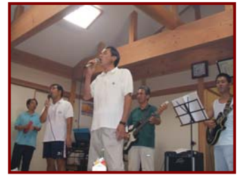
米原今泉区長の熱唱