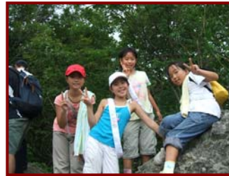
投入堂登山（文殊堂前）