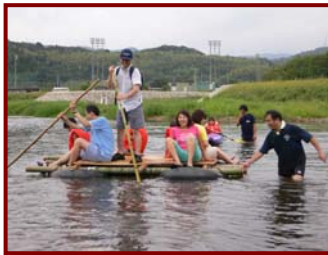
水辺の楽校で筏遊び

今年飛躍的にがんばったのは、助谷、鎌田の2部落です。鎌田は15位から6位と順位を上げ、入賞。助谷は、31位から15位へと大飛躍という結果でした。来年は、さらなる飛躍を期待します。皆さん注目してください。