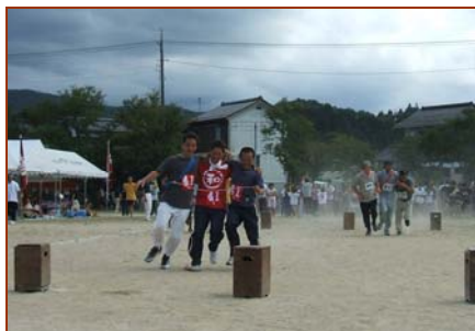
砂塵を巻き上げる「近所でゴー」