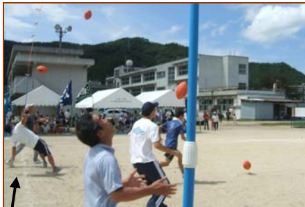
「ボールのはずみの身を任せ」すぎ?