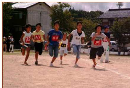
年代別リレー(予選)