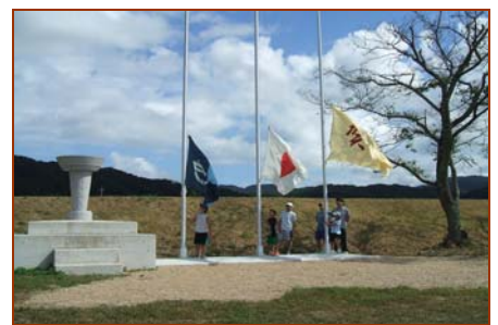
国旗掲揚: 天神の子どもたちが担当。