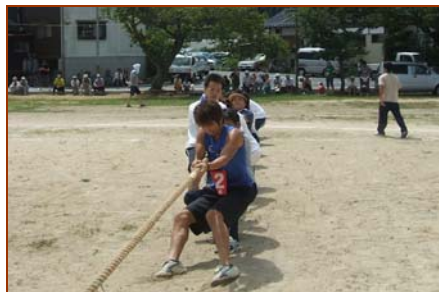
綱引き(赤松第2位) 優勝は天神。(写真がありませんでした。)