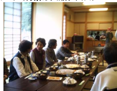
牧の収穫祭（もち、猪肉など）