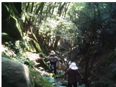
不動滝までもう少し