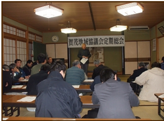
定期総会のようなす（助谷）

平成20年1月30日19:00から助谷地区多目的研修会施設において、平成20年賀茂地域協議会定期総会を開催しました。各集落の区長をはじめ、約40名の参加者で議案として提出した平成19年の事業報告・決算、平成20年の事業計画・予算、規約改正などが承認・可決されました。