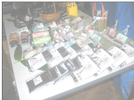
たくさん商品があります