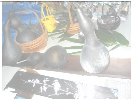
ひょうたんも炭に