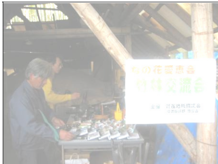
高齢者との交流会