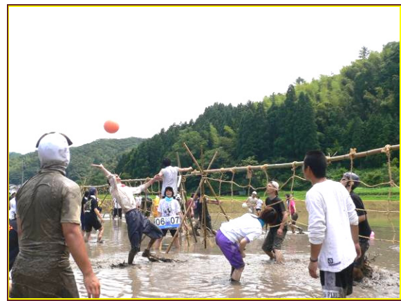
第4回泥んこバレーの試合風景（開催地:鎌田）