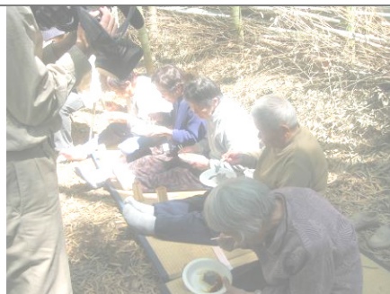
テレビ撮影に緊張気味！？