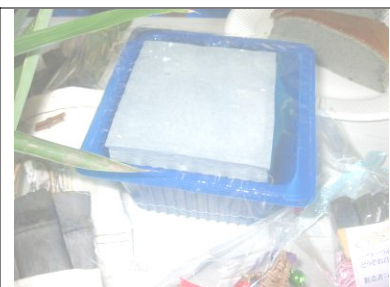
竹炭パウダーを入れた豆腐