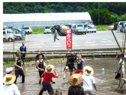
試 合 風 景