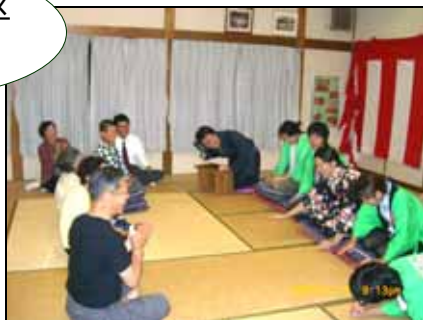
第2回いきいき勉強会 若宮区での様子