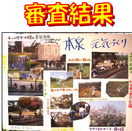
(本泉区) 生活環境部長賞