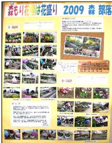
(森区) 賀茂地域協議会会長賞

12月15日に生活環境部会を開催し、コンテスト報告書の審査を慎重に行いました。部会員からいろいろ意見が出され、審査はたいへん難航しました。審査の結果は下記のとおりです。