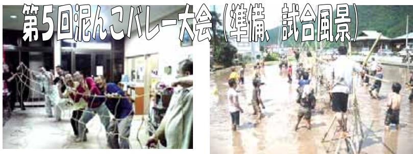
第5回泥んこバレー大会(準備 試合風景)