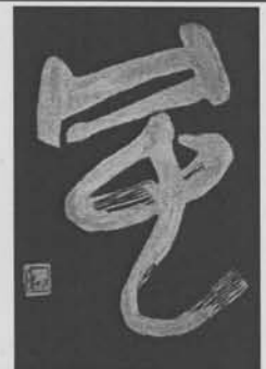
書道サークル作品 風