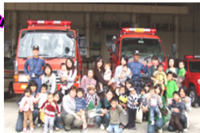
膚 消防署の人と一緒に記念撮影