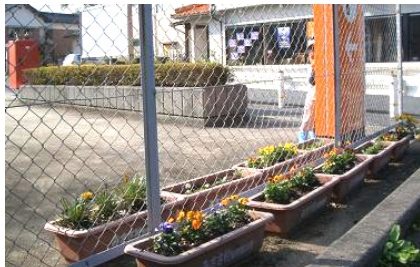
三朝郵便局にピオラの苗を植えました

花を植栽されるグループ・個人の方を募集しましたところ、たくさんのご応募ありがとうございました。これから雪が積もることもあると思いますが、雪の合間から、道行く人の目を楽しませてくれたり、心を和ませてくれることでしょう・・・