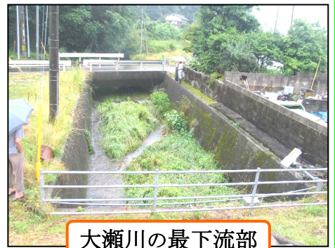
大瀬川の最下流部