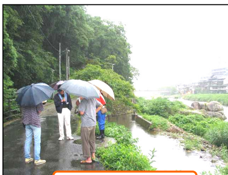
横手用水の取水口