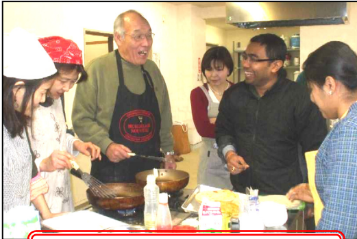
和やかに“ナン”を焼いています

3月28日(土)に三朝町総合文化ホールで、平成21年度最初の事業“料理楽校”を開催しました。