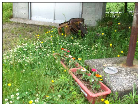
砂原区 (共同浴場前)