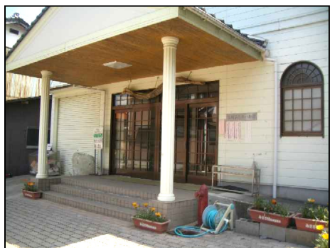
三朝区 (ふれあい会館前)