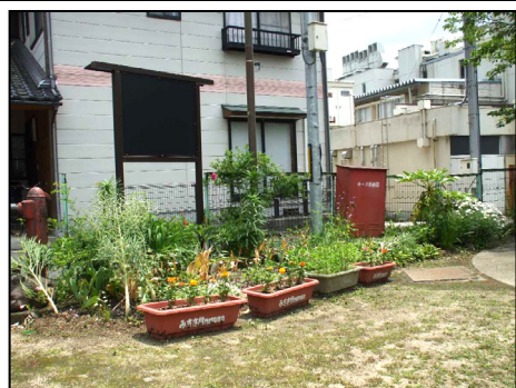
山田沢向花作りクラブ (山田沢向広場)