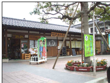
NPO みささ温泉 (湯の街ギャラリー内)