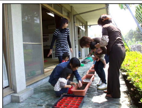
子育てサロン&キラキラサークル (みささ村公民館)