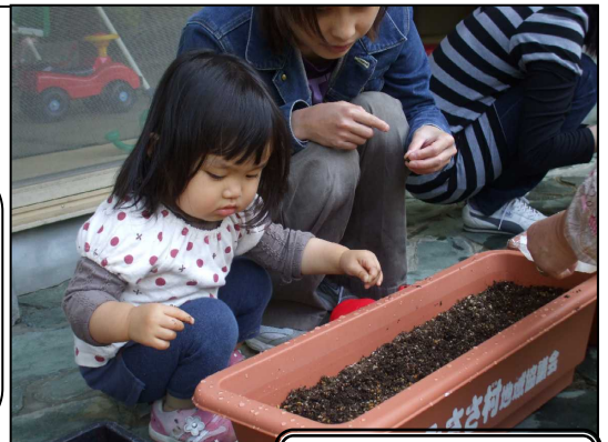
子育てサロンで朝顔のタネまきをしました！