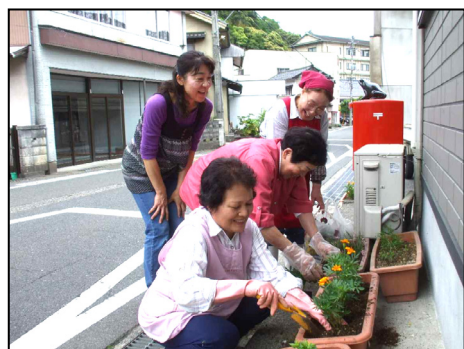
湯の華会 (県道沿い)