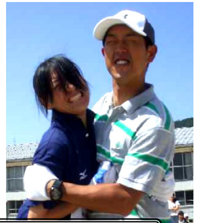
←新競技いかがでしたか？