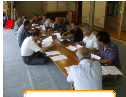
理 事 会

今回の理事会では、過日集落から出された要望のうち、河川・県道整備に関する各集落からの要望箇所の現地調査を実施し、地域活性化のための重要課題としてまとめました。これは、7月に開催される要望会において、国土交通省及び鳥取県へ要望します。