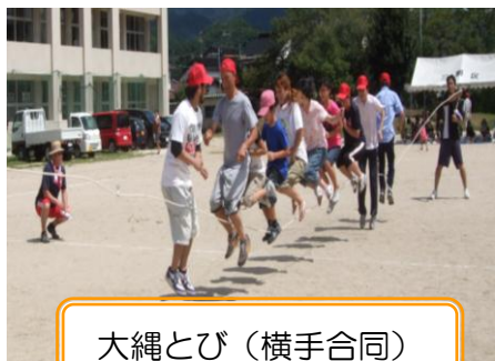
大縄とび（横手合同）