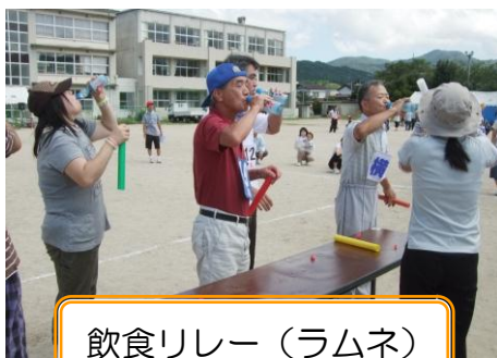
飲食リレー（ラムネ）