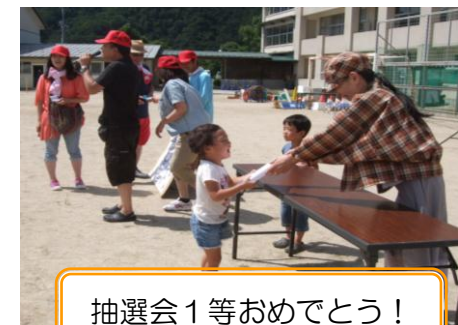
抽選会1等おめでとう！