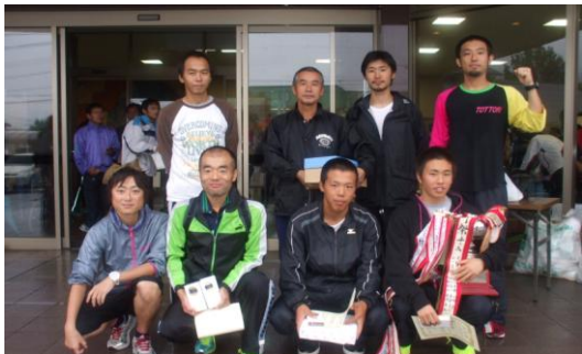
集落対抗 第1位! : 大瀬Aチーム

11月3日(日)みささ村地域から10チームとたくさんの選手の皆さんが、最後までタスキをつなぎました。沿道での温かいご声援、ありがとうございました。