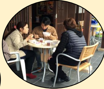
和やかなひとときでした・・・