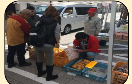
小鹿地域協議会 梨、米の販売