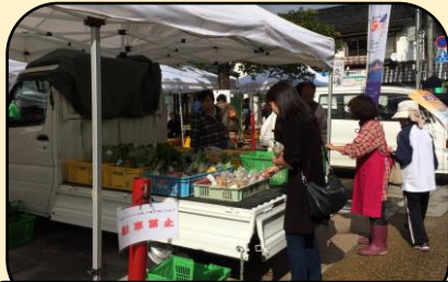
おひさま市 野菜などの販売