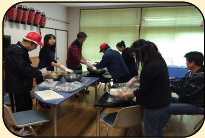
黙々とおにぎりを作ってます！

今年は、ほっとプラ座横温泉広場で開催しました。朝は、雨模様でしたが芋煮が出来上がるころには天候も回復。用意していた200食分の芋煮は、開始1時間ほどで、からっぽとなりました。主役の里芋12キロは、三朝町産(小鹿地域協議会)を使用しました。地域の方、観光客の方とたくさんみなさんにきていただきました。みんなニコニコで何杯もおかわりしていました！