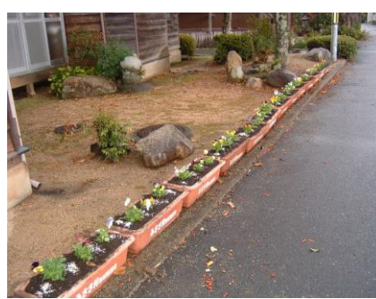
大瀬元気クラブ (大瀬区公民館周辺)