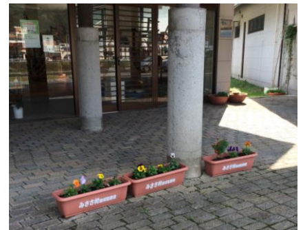
織物工房 (ふるさと健康むら)