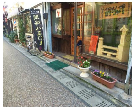
湯の華会 (商店街沿い)