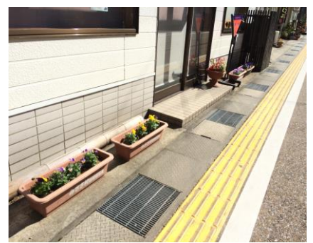
湯の華会 (県道沿い)