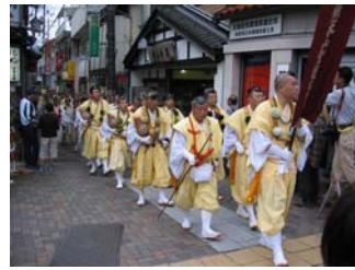
行列が温泉街を練り歩きました