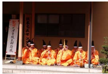
雅楽の奉納(坂本公民館にて)