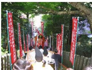
行列が参道を降りる

この日は、県内各地で開催されているスポレク祭参加者や観光客も、温泉街で繰り広げられた時代絵巻に見入っていました。