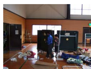
体育館器具庫の整理整頓