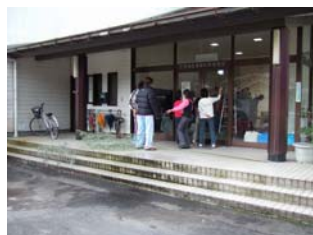
子どもたちが玄関の窓拭き