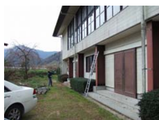
体育館周りのすす払い