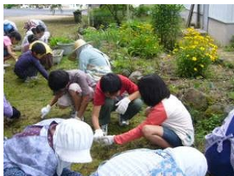
一生懸命草取りをする参加者

“第12回みとく祭”も間近になりました。おかげさまで、センター周りも見違えるようにきれいになり、すがすがしい気持ちでまつりが出来そうです。参加者の皆さん、どうもありがとうございました。