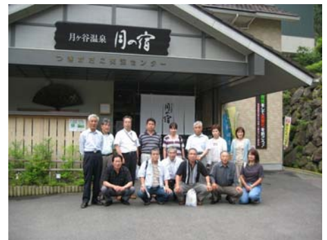
皆さんで記念撮影!!