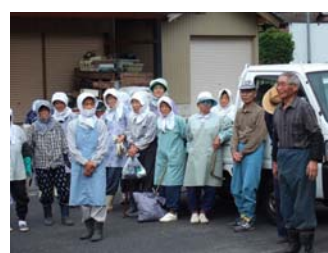
多くの方にご参加いただき、ありがとうございました。