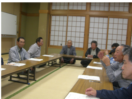
5月9日 地域振興部会