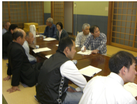
5月21日 ごみの分別学習会