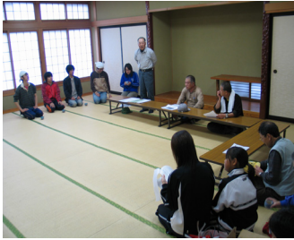
作業内容などの説明を聞くオーナー

三徳地域協議会では、荒廃農地の進行に歯止めをかけること、交流により田舎のよさを情報発信することなどを目的にこの事業を行っています。