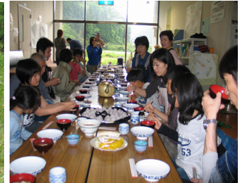
地元米のおにぎりと焼肉で昼食