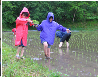
小雨の中、大人も子供たちも、苗植えに奮闘中です