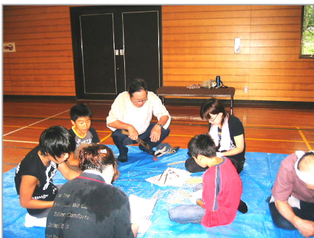
上手に小刀を使っています！