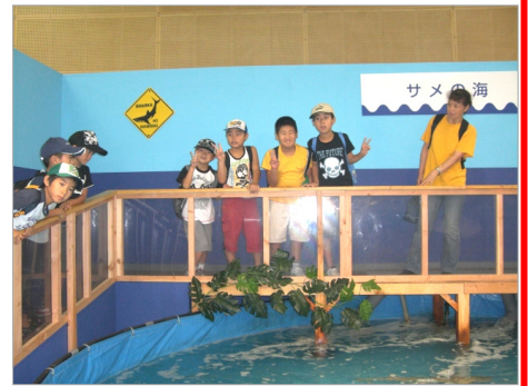
8/21 サメが3匹泳ぎ回っていました