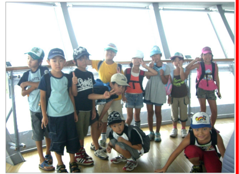
8/21 展望台で記念撮影

バス遠足は、県立夢みなとタワーで開催されていた、ニューカレドニアと南の島の水族館と水木しげるロードに行きました。