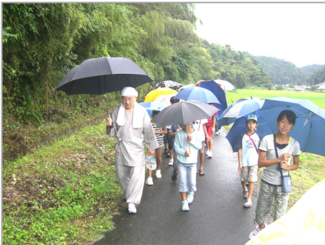
三徳センターから徒歩で炭焼き小屋へ