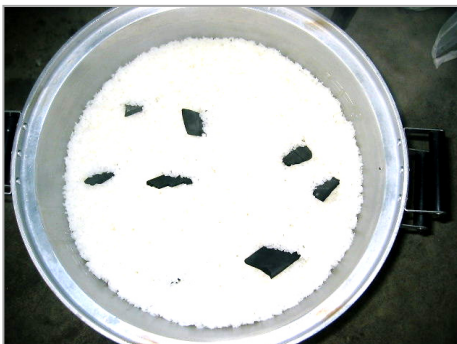
竹炭を入れて炊きあがったご飯は、とてもおいしく、おかわりをする子どもがたくさんいましたよ！