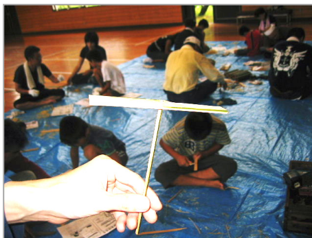
竹とんぼの出来上がり