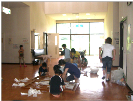
7/30 障子貼りをしました