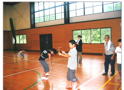
うまく飛んだかな？