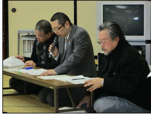
執行部より平成二十四年事業実績及び決算報告、平成二十五年事業計画及び収支予算についての説明。

平成25年度役員等は次のとおりです。一年間お世話になります。どうぞよろしくお願いいたします。