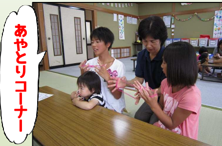
あやとりコーナー