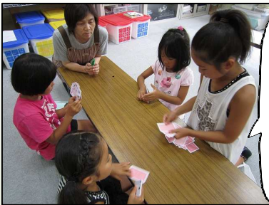
トランプコーナー

青少年・女性・福祉部会主催による『みんなでいろいろな遊びをしてみよう！』が、7月28日（日）に開催されました。地域の親子、役員など総勢約60名の多くの参加者で、楽しいひと時を過ごしました。