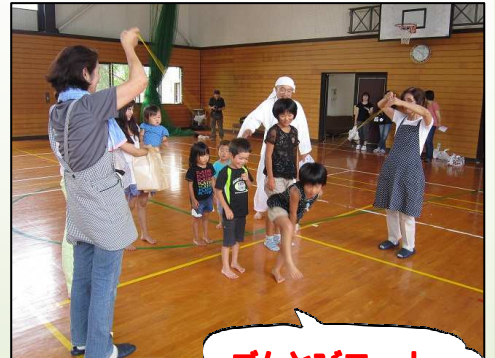
ゴムとびコーナー