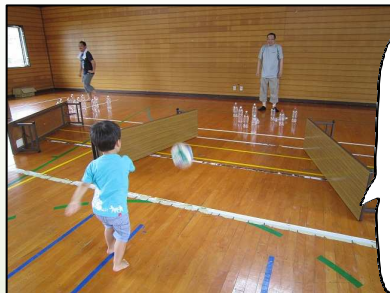
ボリリングコーナー