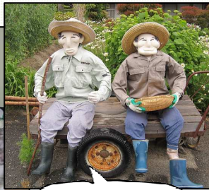
本物の人間と間違えそう!