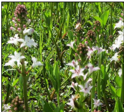
絶滅危惧種である「ミツガシワ」もきれいに咲いていました。