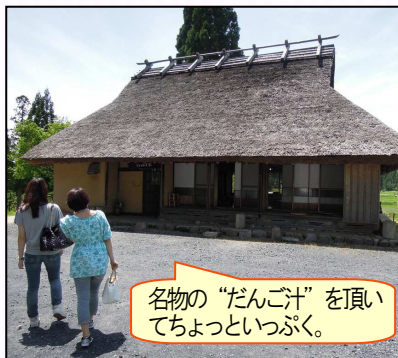
名物の“だんご汁”を頂いてちよつといっぶく。