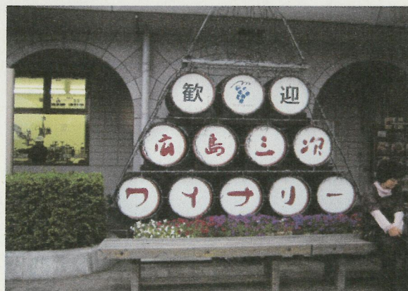
《三次ワイナリーにて》 ワインの試飲があり たくさん飲みました