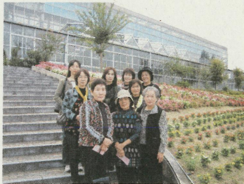
《因島フラワーセンターにて》