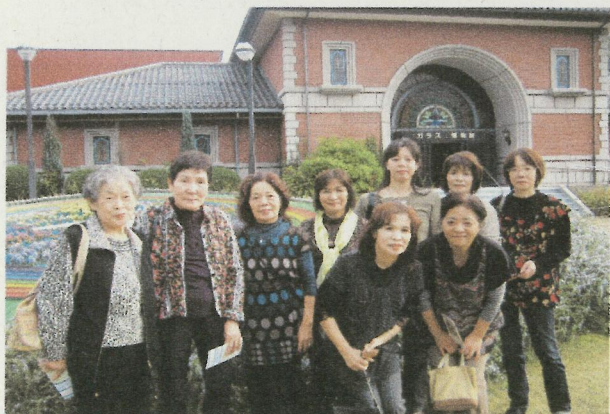
《ガラスの里にて》 ガラスの工芸がたくさん とってもきれいでしたよ